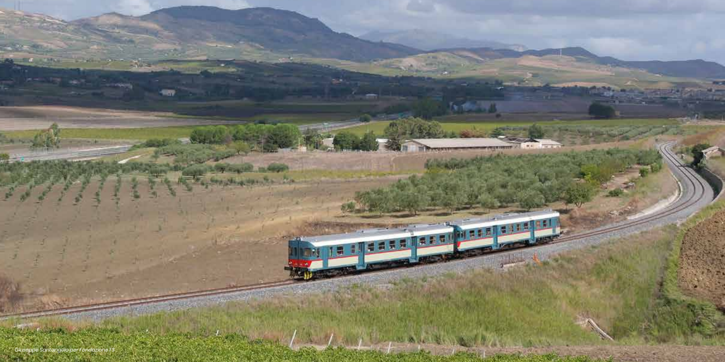
Giuseppe Santangelo per Fondazione FS