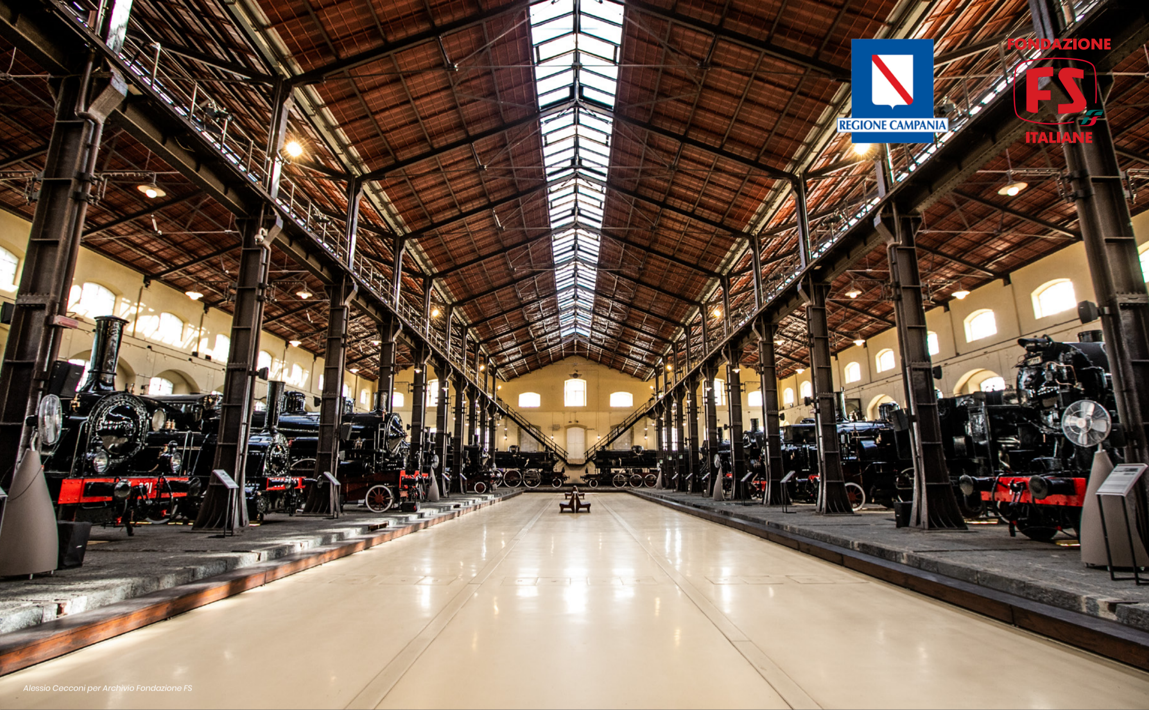
Alessio Cecconi per Archivio Fondazione FS